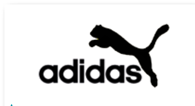
Markenlogos sind nicht nur Qualitätssiegel, sie dienen dem Konsumenten auch als Orientierungshilfen.